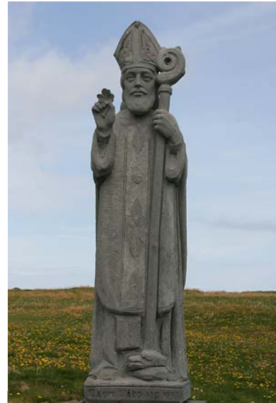
ST.PATRICK STATUE DES NORTH MAYO SCULPTURE TRAILS

Auf diesem Felsen soll einer Legende nach der heilige St.Patrick nach einem Streit den Teufel gelockt haben, um dann die Spitze von der Landzunge zu