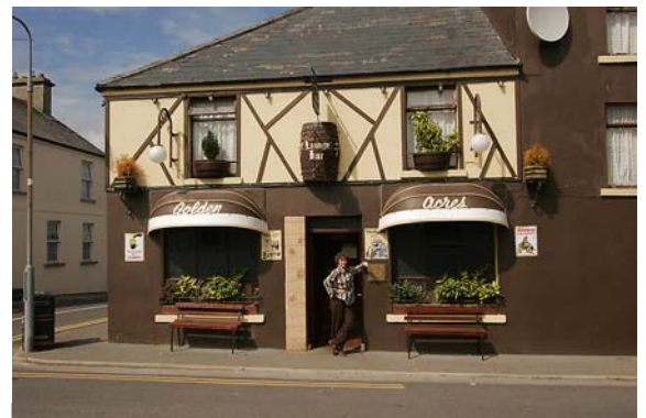
GOLDEN ACRES PUB IN KILLALA

Das Pub ist genial eingerichtet: Hunderte von Bildern (hier scheint auch einmal ein Film gedreht worden zu sein), Utensilien aller Art hingen an der Decke, die