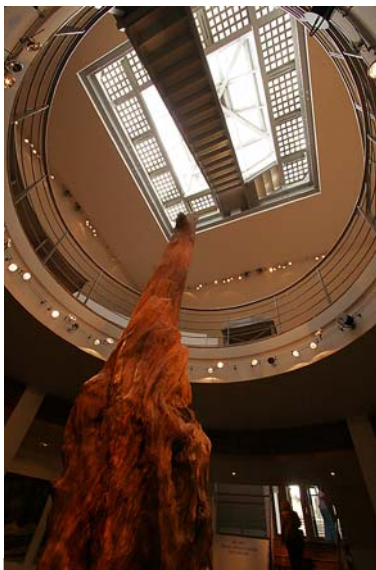
CÉIDE FIELDS VISITOR CENTER INNEN

< Ballycastle: Ceide Fields www.museumsofmayo.com/ceide.htm