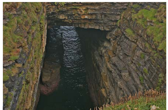
BLICK IN EINES DER BLOWHOLES AM DOWNPATRICK HEAD

Vor den Klippen liegt ein Kunstwerk des North Mayo Sculpture Trails (Tir Saile) : Die Darstellung des heiligen St.Patrick. Der aus 17 Skulpturen bestehende trail, von namhaften Bildhauern kreiert und vom Mayo County Council initiiert, stellt lokale Folklore und Natur künstlerisch dar.