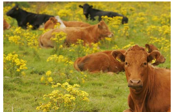
MÜDE - UND ERSTAUNTE KÜHE - VOR KILLALA

Wir fuhren weiter an der Küstenstraße über Rathlackan nach Killala , wo wir das Golden Acres Pub besuchten (ein Tip unserer Nachbarn). Da es noch recht früh war, waren nur wenige Leute in dem großen Pub, ein Guinness und ein Sandwich bekamen wir trotzdem.