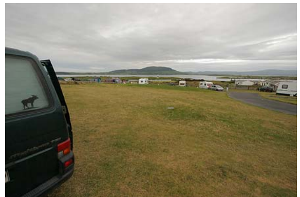
GREENLANDS CAMPING, ROSSES POINT - DIREKT AM MEER