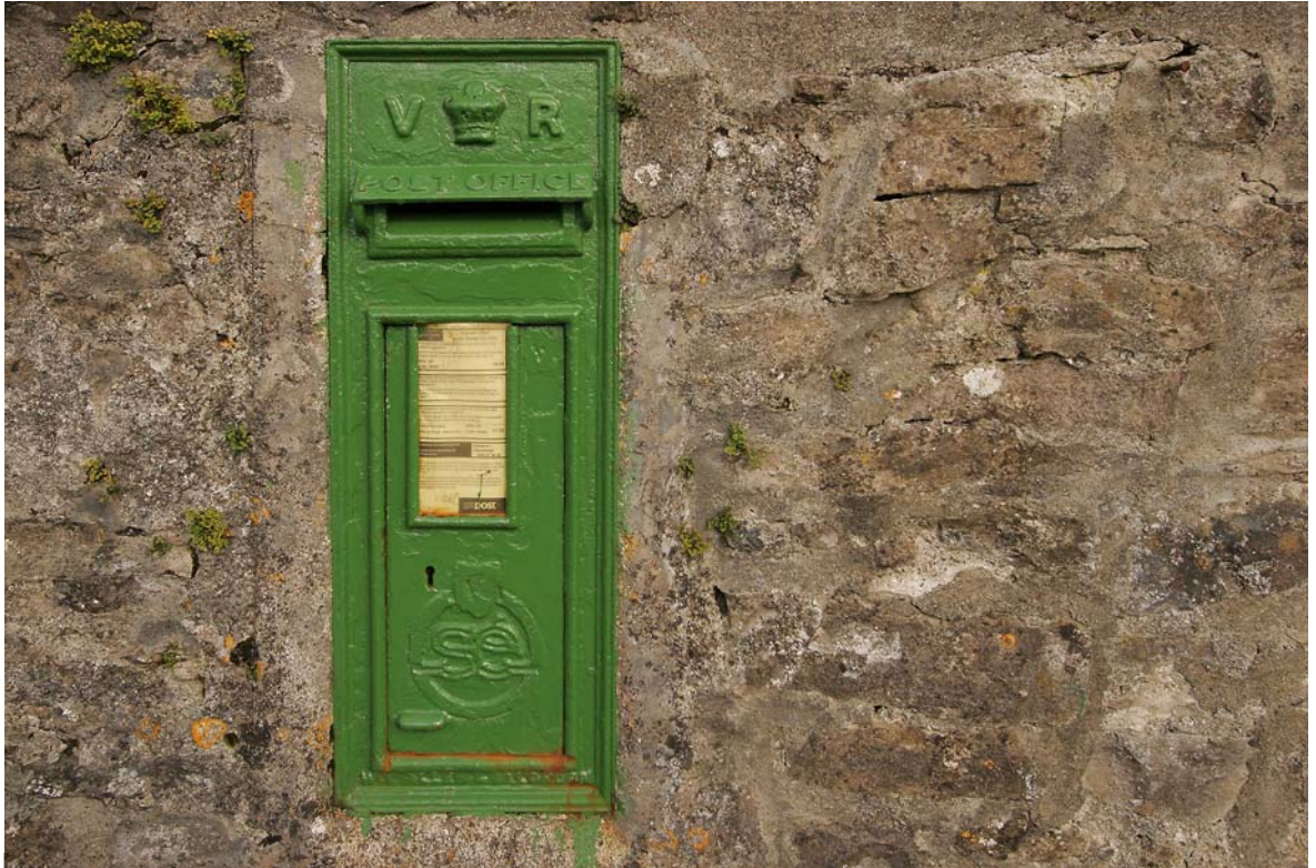
IM GEGENSATZ ZU DEN BRITISCHEN UND DAMIT AUCH NORDIRISCHEN POSTKÄSTEN SIND DIE DER REPUBLIK HEUTE GRÜN ...

< Camping: Greenlands Caravan and Camping Park **** Rosses Point