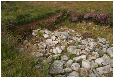
CÉIDE FIELDS - AUßENBEREICH MIT WEISSEN PFÖSTEN UND AUSGRABUNGSBEREICH: HIER SIEHT MAN DIE VERSUNKENEN MAUERN VON OBEN

und interessante Weise an den Besucher heran. Dazu trägt auch ein Videofilm bei. Im Außenbereich