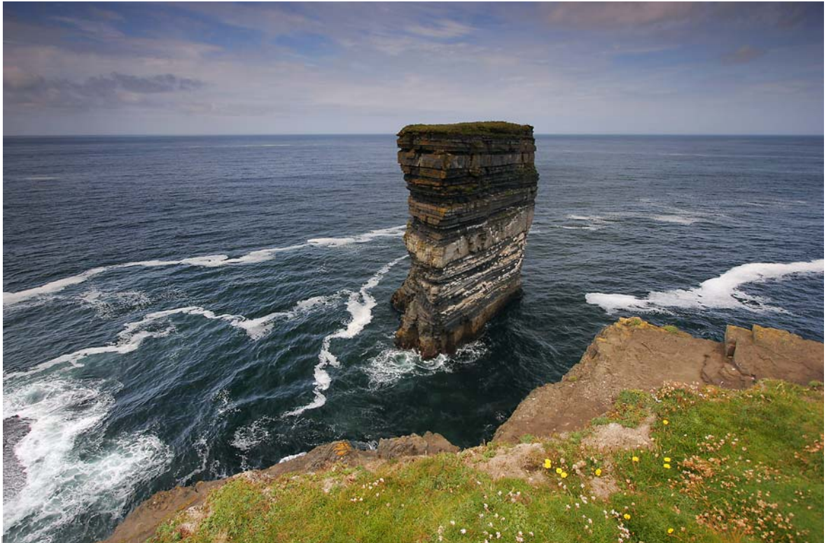
DUN BRISTE AM DOWNPATRICK HEAD - HIER SOLL DER TEUFEL HEUTE NOCH SITZEN ...